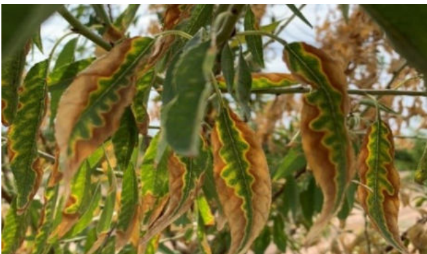
Սկ. 4. Լշենու տերևների այրվածք հիվանդության ախտանշանները Պենտա սորտի ծառի տերևների վրա:

Լշենու Լորան սորտի ծառերի վրա որևէ հիվանդություն չի հայտնաբերվել: