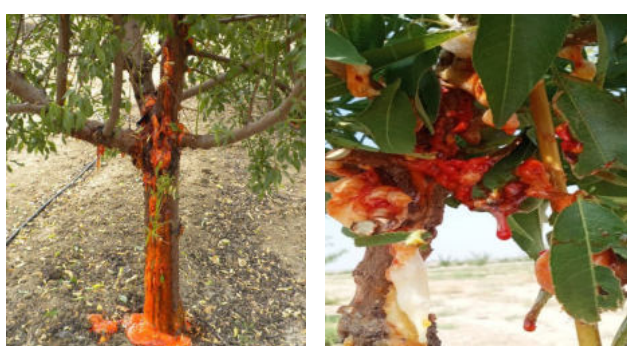
Նկ. 1. Փրփրանման քաղցկեղ հիվանդության ախտանշաններով նշենի ( www.thealmonddoctor.com ):

Հունիսի երկրորդ տասնօրյակում նշենու Գուարա սորտի ծառերի վրա հայտնաբերվել են կորիզավոր ծառատեսակների ծակոտկեն բծավորություն (նկ. 2) և գոմոզ (նկ. 3), իսկ Պենտա սորտի ծառերի վրա՝ գոմոզ և բլրոզ (ոչ վարակիչ) հիվանդությունները (գծ.):