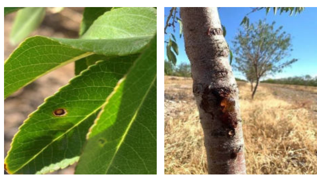
Նկ. 2. Կորիզավորների ծակոտկեն բծավորության ախտանշաններ: Նկ. 3. Նշենու բնի վրա գոմոզ հիվանդության ախտանշաններ: