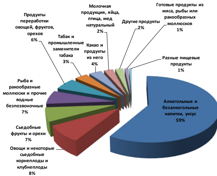
Рис. 1. Товарная структура экспорта с/х продуктов и продовольственных товаров из Армении в Россию в 2018 г., %. Составлено авторами на основе: Разакова Д.А. Современное состояние аграрного рынка стран-участниц ЕАЭС и возможные модели развития. 2015.